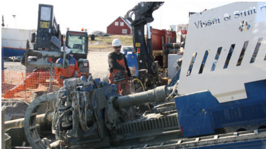
TELE Greenland: Underboring af søkablet, juni 2012.

Kl. 19:00 Efter generalforsamlingen – cirka ved 19-tiden – er selskabet vært ved en middag bestående af gule ærter med traditionelt tilbehør. Der slutes af med kaffe/ te.